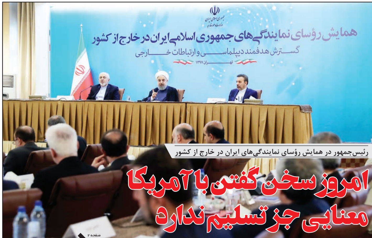
رئیس جمهور در همایش رؤسای نمایندگی‌های ایران در خارج از کشور

امروز سخن گفتن با آمریکا معنایی جز تسلیم ندارد