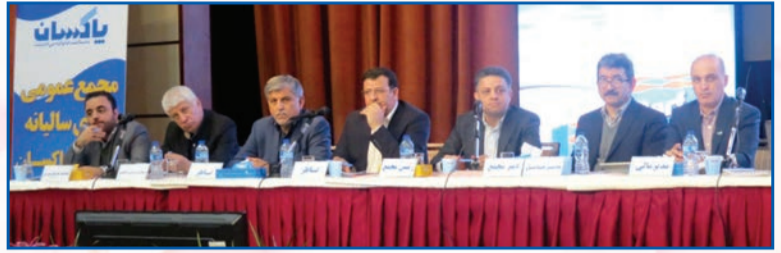
شادکامی و بهروزی همگان را از درگاه ایزد منان مسئلت می‌نمائیم.

مجموعات و خدمات: شرکت پاکسان به عنوان یکی از قدیمی‌ترین و بزرگترین شرکت‌های تولیدکننده در کشور دارای سبد کامل محصولات شویونده و بهداشتی مالک برندهای مشهور و با سابقه، با بیش از ۱۵۰ کد کالا (SKU) در حوزه مذکور به فعالیت می‌پردازد. برند سپید در بخش پودرهای ماشینی، برند پرف، گیمیا و ارکید در قسمت پودرهای دستی، برند سبوی، گلنار و عروس در حوزه مایون و بهداشتی و حمام و همچنین مواد اولیه محصولات صنعتی مثل گلیسرین، اسیدجرب، اسید سولفونیک و سدیم لوریل اتیل سولفات با نام تجاری پاکساپون از عمده محصولات این شرکت می‌باشد. این شرکت با توجه به پتانسیل بالای تولید اقلام فوق بخشی از ظرفیت تولید خود را به فروش آنها به سایر تولیدکنندگان محصولات نهایی اختصاص داده است. مالکیت برندهای شبنم، گلی، پونه و نسیم نیز در اختیار پاکسان قرار دارد که تولید محصولات مربوط به آن تحت لیسانس شرکت پاکسان و در شرکت‌های سابنا و گلنار که از شرکت‌های مجموعه مدیریت صنعت شویونده می‌باشند، تولید می‌گردد و بابت آنها حق لیسانس دریافت می‌نماید.