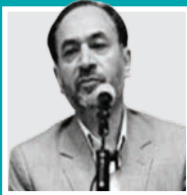
کارشناس مسائل منطقه:

گسترش روابط تهران و بغداد در شرایط حساس منطقه