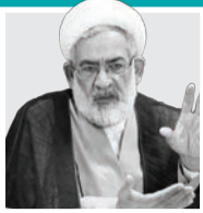
دادستان کل کشور:

بخشی از آسیب‌های سیل اخیر ناشی از سوءمدیریت‌هاست