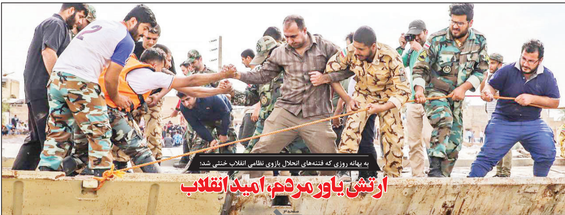
به بهانه روزی که فتنه‌های انحلال بازوی نظامی انقلاب خنثی شد؛

پنجشنبه ۲۹ فروردین ۱۳۹۸ • ۱۲ شعبان ۱۴۴۰ • سال نوزدهم • شماره ۵۰۰۱ • ۸ صفحه • قیمت: ۱۵۰۰ تومان • info@siasatrooz.ir • www.siasatrooz.ir • Vol.18 • No.5001 • THU, Apr 18, 2019