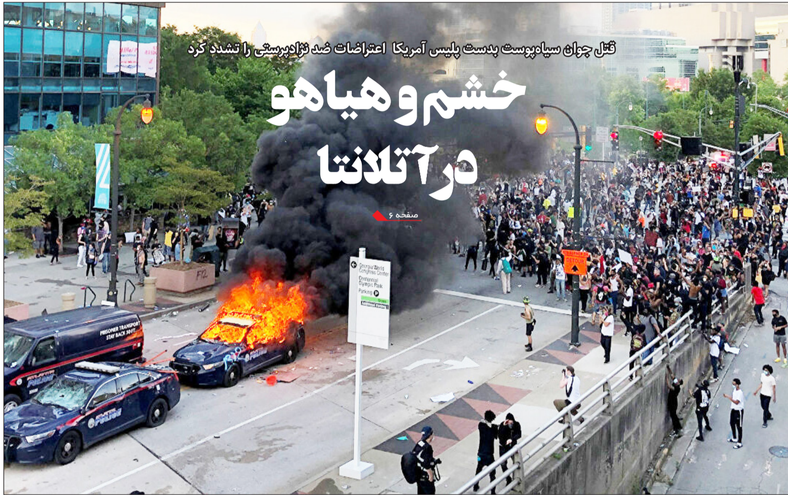
قتل چوچاق سیاه‌پوست بدست پلیس آمریکا اعتراضات ضد فزایدپرستی را تشدید کرد