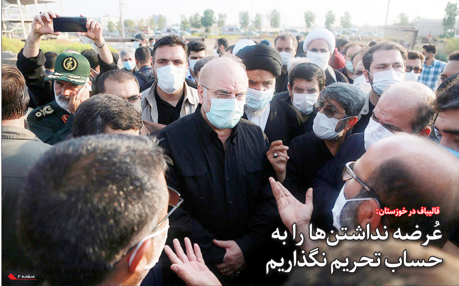
قالیپاف در خوزستان:

سوم آنکه سناریوی بعدی را در برجام می‌توان جستجو کرد. کشورهای اروپایی در حالی حاضر به اجرای تعهدات برجامی نیستند که همزمان از یک سو به دنبال حفظ ظاهر برجام هستند تا در لوی آن محدودسازی هسته ای، فشار منطقه‌ای و