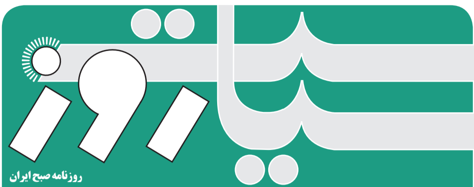
روزنامه صبح ایران