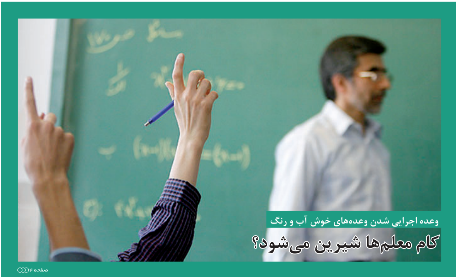
وعده اجرایی شدن وعده‌های خوش آب و رنگ